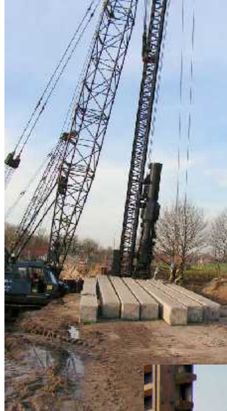
foto 3: jan. 2008, tweemaal acht heipalen worden de toekomstige bruggenhoofden ingedreven.

foto 2: dec. 2007, nieuw dijklichaam van bouwzand op die fantastisch berijpte dag.