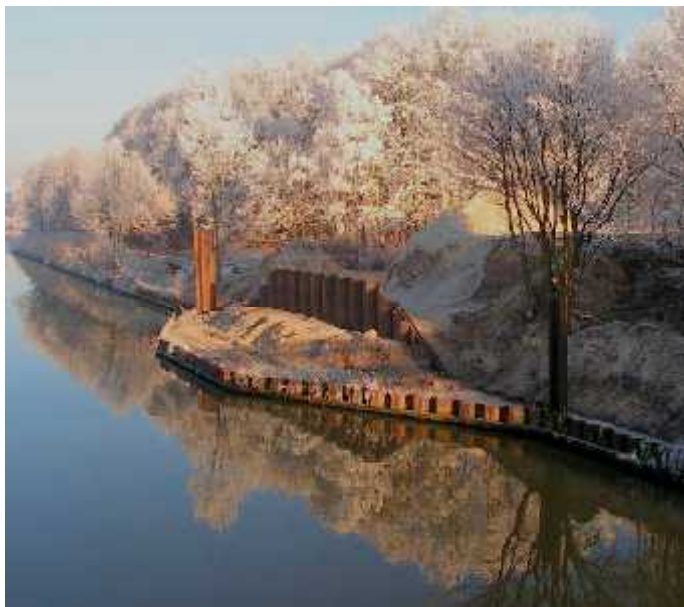
foto 2: dec. 2007, nieuw dijklichaam van bouwzand op die fantastisch berijpte dag.

foto 1: nov. 2007, slaan van nieuwe damwandprofielen, schuin van laag naar hoog.