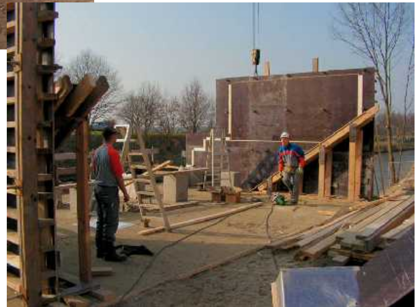
foto 4: febr. 2008, de bekisting wordt getimmerd, daarna gaan de ijzervlechters aan de slag.

foto 3: jan. 2008, tweemaal acht heipalen worden de toekomstige bruggenhoofden ingedreven.