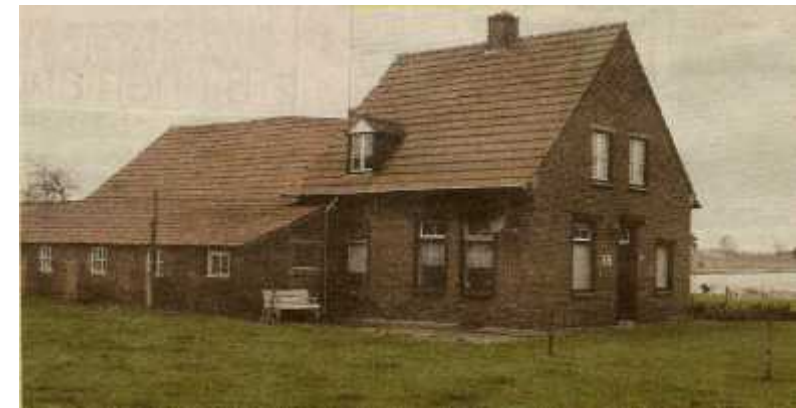
Wessemerdijk nr. 12, rechts het nieuw gegraven natuurgebied

(. . .) via een kennis uit Almkerk geprobeerd als ‘pionier’ in de Noord-oostpolder aan een boerderij te komen, want ik kende dat gebied, maar dat lukte niet. Ik was met mijn zeventiende voor drie jaar naar de Noordoostpolder gegaan voor de ontginning. (. . .)