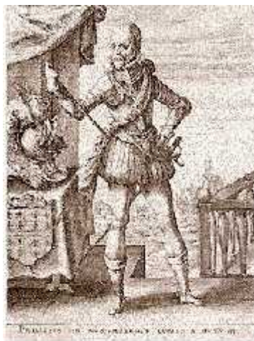
De Graaf van Horn

Hij leende zijn naam aan de bekende scholengemeenschap in Weert, waar elke (nou ja, elke) leerling zijn geschiedenis kent: de succesvol legeraanvoerder in het Spaanse leger, die zich verzette tegen de terreur van de Spanjaarden en in Weert en Doornik een gedoogbeleid voerde jegens de protestanten; door Alva – onder valse voorwendsels - werd gevangen genomen en ondanks hun ‘onschendbaarheid’ als dragers van het GULDEN VLIES samen met de eveneens katholieke en aan Spanje trouw gebleven graaf van Egmond op de markt in Brussel werd onthoofd: het begin van de onafhankelijkheidsstrijd van onze Lage Landen tegen Spanje; de TACHTIGJARIGE OORLOG (1568 – 1648)