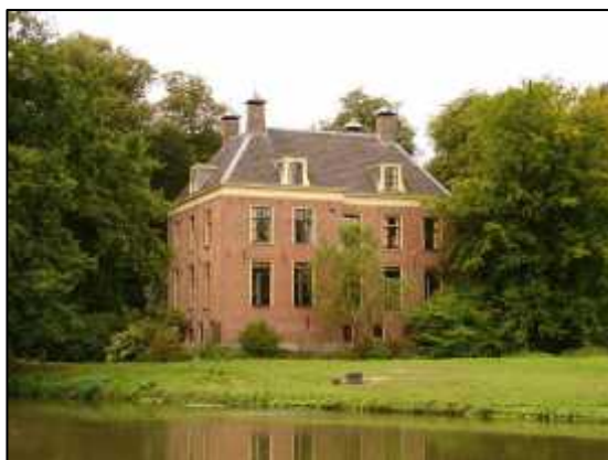
De oudste – nog bestaande - jeugdherberg van Nederland is sinds 1933 gevestigd in kasteel Rhijnauwen bij Bunnik (Utr.)

Het was een Duitse onderwijzer, die rond 1912 het idee van de jeugdherberg bedacht en vanaf 1929 kon je op deze manier ook door Nederland trekken. Het doel was om jongeren uit de hele wereld met elkaar in contact te brengen en dat idee bestaat nog steeds; alleen wordt het nu wat commerciëler ingevuld.