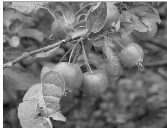
appeltjes van de Malus "Evereste".

In aril/mei bloeien ze prachtig in het wit of roze. Helaas duurt dit maar even. Als de bloesem valt is het net alsof het sneeuwt. De meeste zijn groenbladig maar van sommige is het blad purperrood. Een aantal groenbladige soorten krijgen een schitterende herfstkleur.