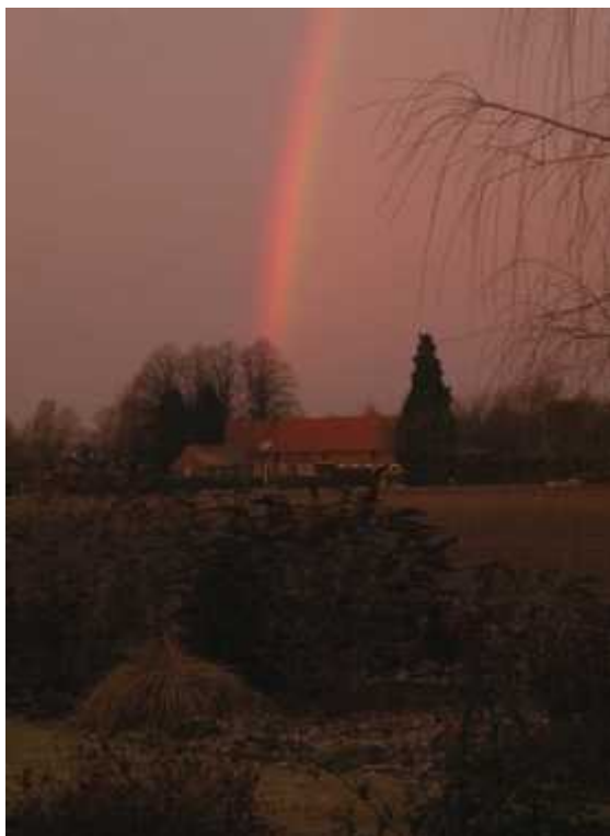
Deze foto heb ik gemaakt in januari 2011. De boerderij van familie Truyen en een regenboog. Jammer dat 't buurtblaedje niet in kleur is.

We hebben prachtige dagen gehad maar ook veel nattigheid. “Ieder nadeel heb zijn voordeel” zou Johan Cruijff zeggen. Met een beetje mazzel zie je namelijk een regenboog.