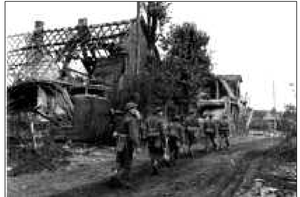
Foto: Engelse soldaten in Overloon waar in november 1944 een hevige tankslag woedde veel soldaten het leven lieten.